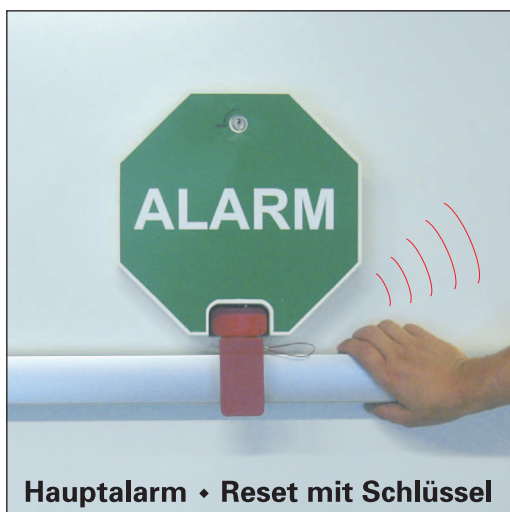
Hauptalarm • Reset mit Schlüssel

Der Stangenalarm für Pushbars ist eine zuverlässige Sicherung für Pushbar-Panikstangen.